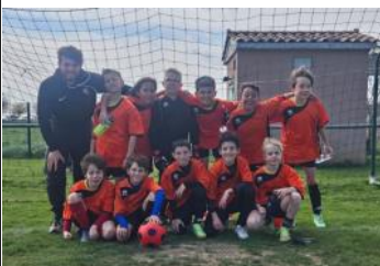
Photo du groupe U11 à Donzère

Trois plateaux ont été organisés, deux le samedi 3 février, un plateau U7 le samedi matin avec la présence de 13 équipes, et un plateau U9 le samedi après-midi avec 10 équipes. Un plateau U11 a été organisé le samedi 9 mars avec la participation de 4 équipes. De très belles journées avec les enfants sous le soleil.