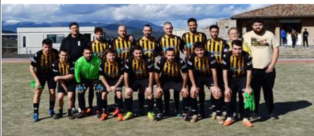
L'équipe A.S. Roussas-Granges-Gontardes 2 le 10 mars sur le stade de la Raze à Lablachère avant la rencontre contre l'équipe de l' Athletic Foot Ceven 2

les Seniors 1, avec un match en retard, sont 4 e de la poule de D3, les Seniors 2, dans la poule accession, sont 3 e de la poule de D5, à 5 points du premier. Une fin de saison qui sera sans aucun doute palpitante.