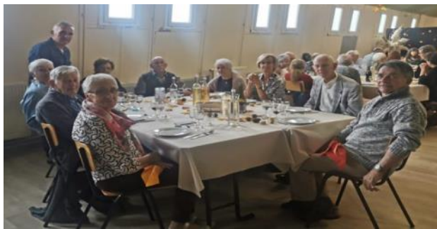
Repas du 9 octobre