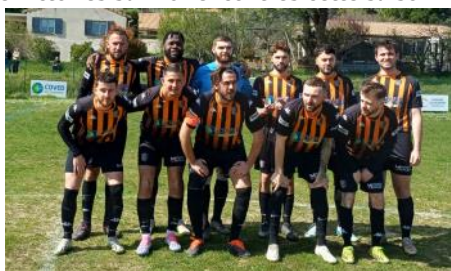
L'équipe A.S. Roussas-Granges-Gontardes 2 le 30 mars à domicile avant la rencontre Roussas A.S. 2 - St Montan Ol 2. Un match remporté par 5 buts à 1.

Un match remporté par 2 buts à 1 par nos joueurs face à un adversaire sérieux et efficace, 8 victoires sur 16 rencontres cette saison.