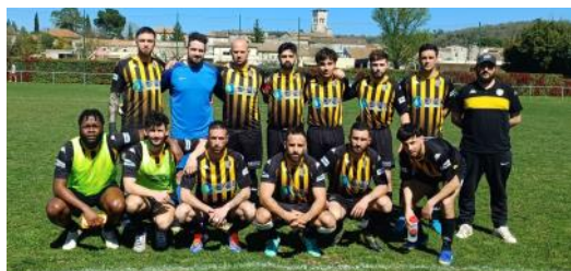
L'équipe A.S. Roussas-Granges-Gontardes 1 le 6 avril sur le stade de Ruoms avant la rencontre contre Ruoms 2.

Un match remporté par 2 buts à 1 par nos joueurs face à un adversaire sérieux et efficace, 8 victoires sur 16 rencontres cette saison.